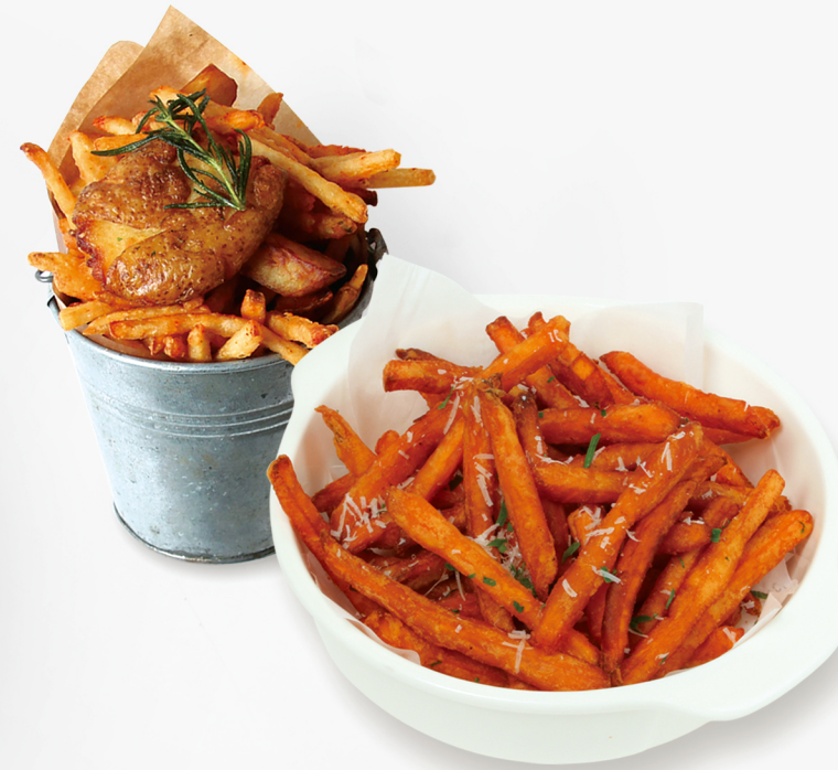
O' 프리츠 O' Frites