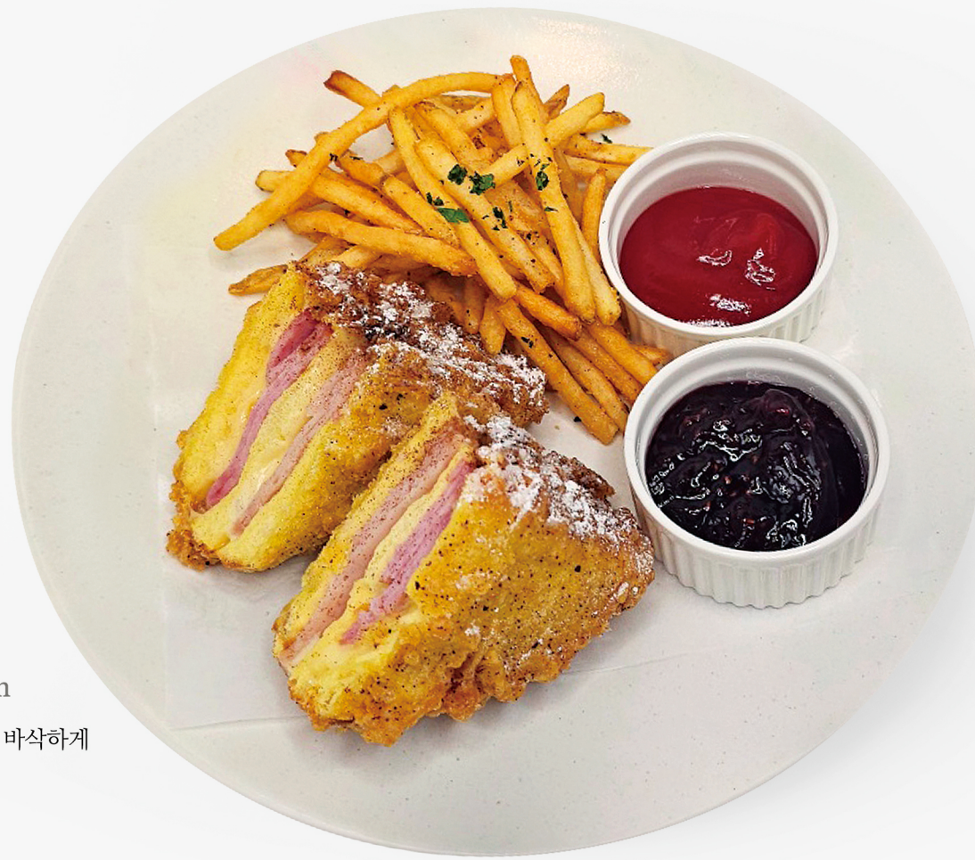
몬테 크리스토 Monte cristo sandwich